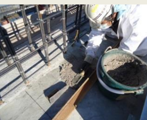
モルタルをコテで平らに敷き詰めてください