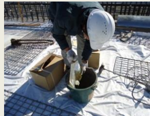
主剤・硬化剤を攪拌、特殊骨材を入れ攪拌