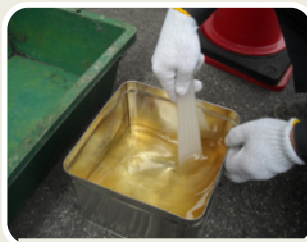
樹脂を先に混ぜて塗ってください