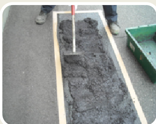
コテで平らに押さえてください