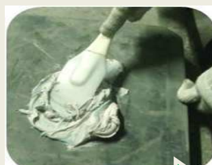
ヘラ・コテで穴埋