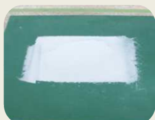
細かな突起、段差を削って下さい