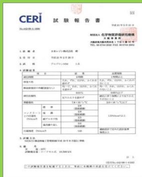
NEXCO 構造物施工管理要領(平成19年度8月版) 左官工法による断面修復の性能照査項目基準値に対応